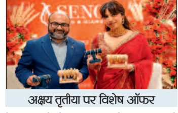
अक्षय तृतीया पर विशेष ऑफर

कोलकाता। सेन्को गोल्ड एंड डायमण्ड्स ने अपने बहुप्रतीक्षित 'बैंगल उत्सव 2026' की शुरुआत की है। यह विशेष अभियान पोइला बोइशाख और अक्षय तृतीया जैसे शुभ अवसरों के मद्देनजर पेश किया गया है, जिन्हें सोना खरीदने के लिए अत्यंत शुभ माना जाता है। 85 वर्षों से अधिक पुरानी विरासत वाले इस बांड के देशभर में 200 से अधिक आउटलेट्स हैं। बैंगल उत्सव के माध्यम से कंपनी ने 10,000 से अधिक डिजाइनों का कलेक्शन प्रस्तुत किया है, जिसमें 500 नए डिजाइन्स शामिल हैं। यह